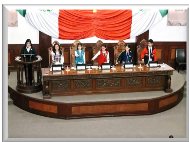
Toma de Protesta e Instalación del Parlamento Estudiantil Coahuila 2025.