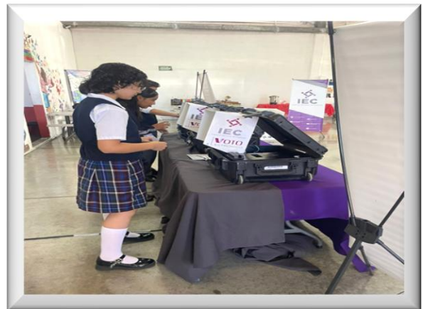
Ejercicios Democráticos en planteles educativos de los 16 Distritos Electorales Locales.