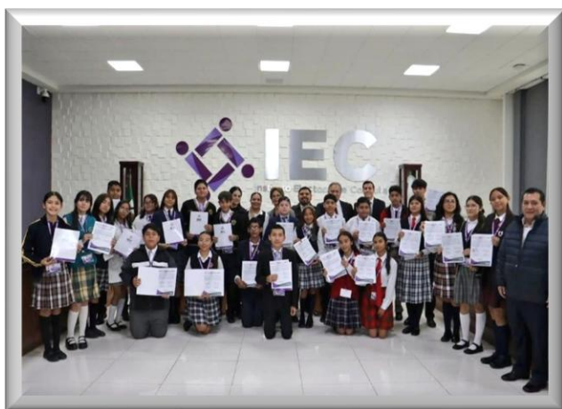
Entrega de Constancias de Mayoría Relativa y de Representación Proporcional.

Posteriormente se realizó la toma de protesta de las 25 diputaciones estudiantiles, e instalación del Parlamento Estudiantil, en el H. Congreso del Estado de Coahuila de Zaragoza. Cabe hacer mención que se recibieron 285 propuestas para el desarrollo de este Programa.