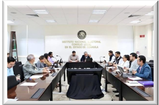
Reunión de trabajo INE-IEC