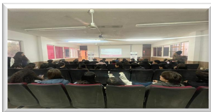
Curso-Taller Ciudadanía Digital “Soy Digital” en la preparatoria de la UANE