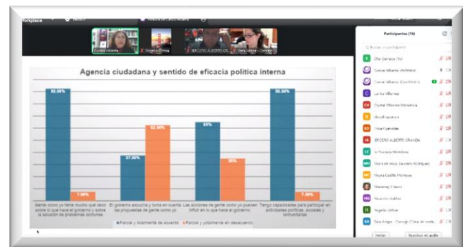
Curso-Taller "Educación ciudadana: de la desafección política al compromiso cívico"