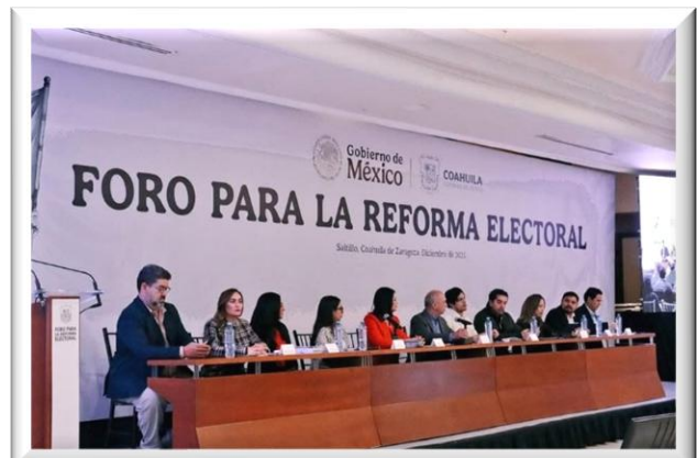
Foro para la Reforma Electoral