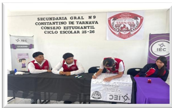
Ejercicios Democráticos realizados en escuelas secundarias del Estado.