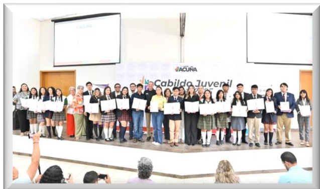
Ejercicio Democrático y entrega de Constancia del Cabildo Juvenil Electo de Acuña