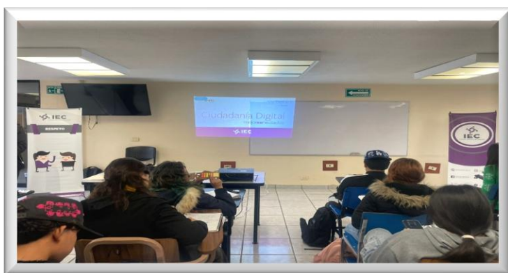
Curso-Taller Ciudadanía Digital “Soy Digital” en la Preparatoria N°1, de la UAC

En seguimiento a los programas plasmados en el Plan Anual de Trabajo 2025, en materia de Educación Cívica, se impartió el Curso-taller Ciudadanía Digital “Soy Digital”, a 116 estudiantes que cursan la preparatoria en la Universidad Autónoma del Noreste (UANE), y la Preparatoria Número 1 de la Universidad Autónoma de Coahuila, (UAC) con el objetivo fue fortalecer entre las juventudes, el pensamiento crítico, para discernir información falsa, y fomentar una convivencia en línea saludable, al promover el uso responsable de las herramientas digitales, para una participación democrática activa y colaborativa.