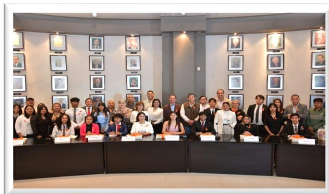
Toma de Protesta del Cabildo Juvenil Acuña 2025